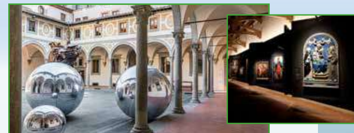
Museo degli Innocenti

12:30 Pranzo al ristorante Lorenzo de' Medici, ristorante tipico nel centro di Firenze