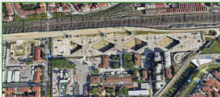
Cantiere nuova stazione AV di Firenze

N.B. Consideriamo, di solito, un massimo di 50 partecipanti per singola visita. Inoltre, una settimana prima dell'evento avremmo bisogno dell'elenco dei partecipanti e dei relativi numeri di scarpe. In quanto daremo a tutti scarpe da cantiere, caschetti e gilet RFI.