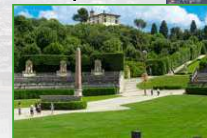
Giardini di Boboli