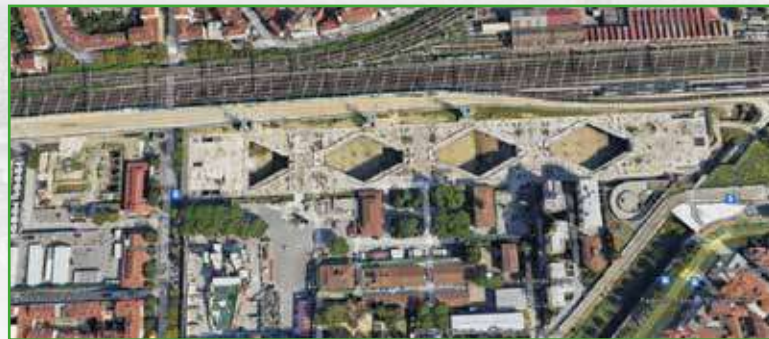
Cantiere nuova stazione AV di Firenze

N.B. We usually consider a maximum of 50 participants per single visit. Also, a week before the event we would need the list of participants and their shoe sizes. As we will give everyone safety shoes, helmets and RFI vests.