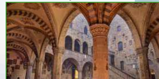
Museo del Bargello