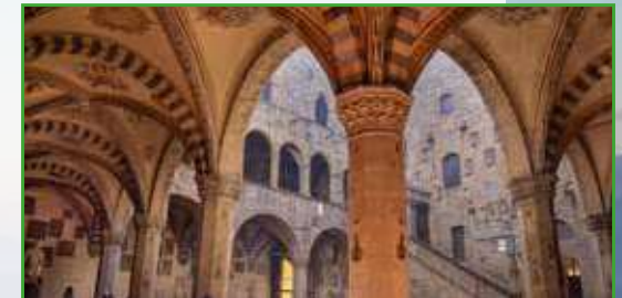
Museo del Bargello