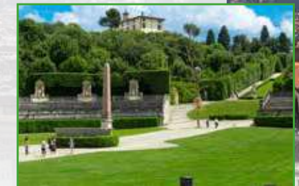
Giardini di Boboli