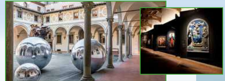
Museo degli Innocenti

12:30 Lunch at Lorenzo de' Medici, a typical restaurant in the centre of Florence