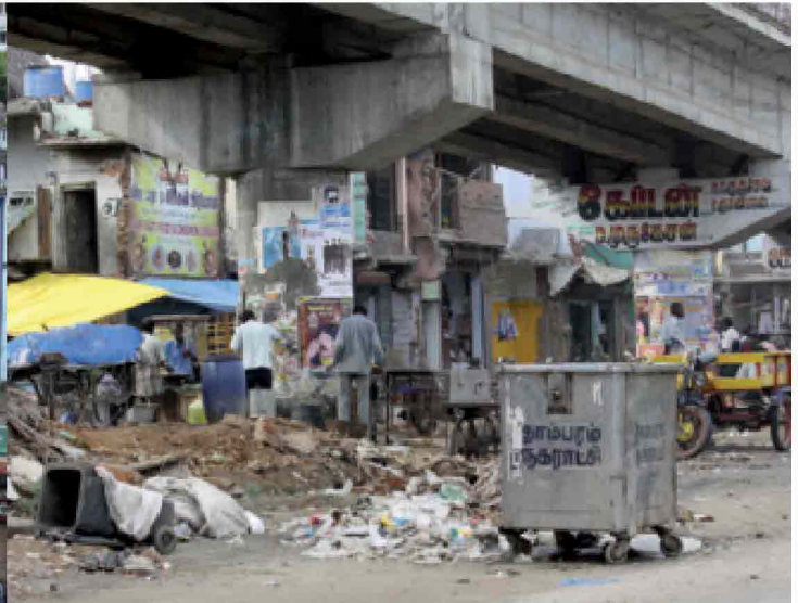
Infrastrutture per i trasporti (strade, ferrovie, aeroporti, porti), sistemi di gestione del traffico e dei rifiuti, potabilizzazione dell'acqua, catena del freddo per prodotti ortofrutticoli, sono alcuni dei settori che contribuiscono alla maggiore qualità infrastrutturale e dei quali in India c'è grande bisogno.