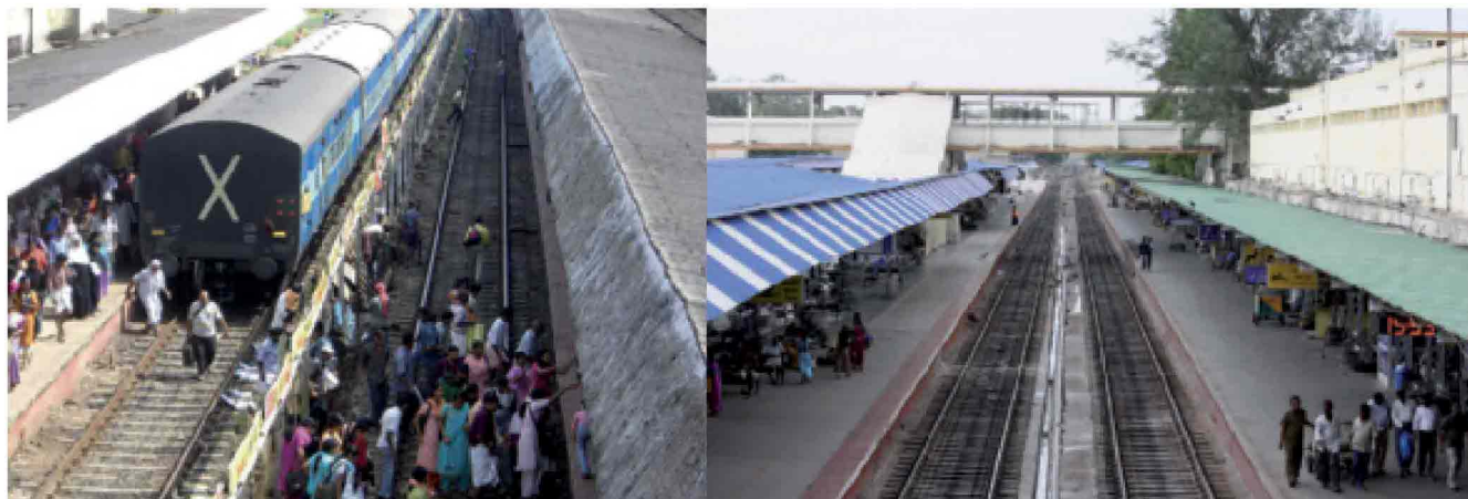
Fra gli investimenti infrastrutturali già pianificati nell'Undicesimo Piano vi sono le strade e autostrade, a cui sono destinati 69 miliardi di euro, le ferrovie, 49 miliardi, i porti, 16 miliardi. Al settore dell'energia sono stati riservati 126 miliardi di euro: la crescita della domanda di elettricità cresce in modo vertiginoso.