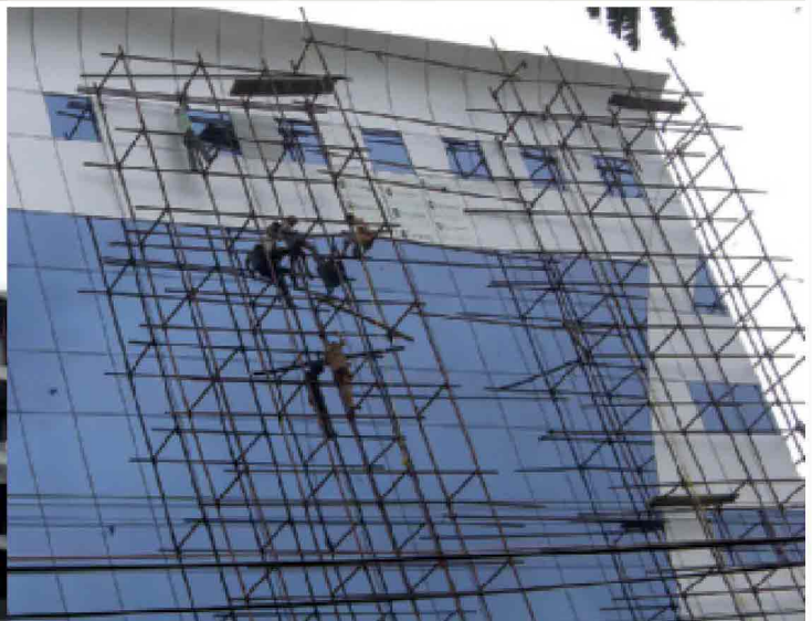
Per il piano infrastrutture il governo indiano punta molto sul Public private partnership, un aspetto su cui le imprese italiane devono migliorare la loro capacità di intervento. Non è sufficiente essere affiancati dal sistema finanziario, perché occorre coinvolgere anche le imprese di gestione dei servizi pubblici locali, tra le quali ci sono molte eccellenze.