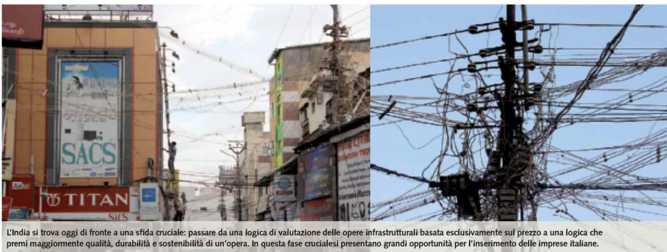
L'India si trova oggi di fronte a una sfida cruciale: passare da una logica di valutazione delle opere infrastrutturali basata esclusivamente sul prezzo a una logica che premi maggiormente qualità, durabilità e sostenibilità di un'opera. In questa fase cruciale si presentano grandi opportunità per l'inserimento delle imprese italiane.

Lo Stato di Orissa, invece, sta emergendo come importante destinazione di investimento, specialmente in grandi progetti minerari e industriale (nei settori acciaio e alluminio) che creano molti posti di lavoro. È il primo stato in cui è stato istituito un ufficio Ppp, in quanto sono aumentati considerevolmente i progetti dei privati negli ul-