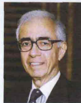
President of IICCI