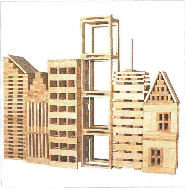
Uno Skyline costruito con giocattoli in legno CITIBLOCS.