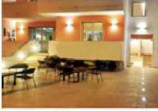
Hotel La Punta *** Otranto (Le) ... a 50 m. dal mare

Ad EnergyMed si parla di Responsabilità Sociale Condivisa Dal 10-04-2013 al 13-04-