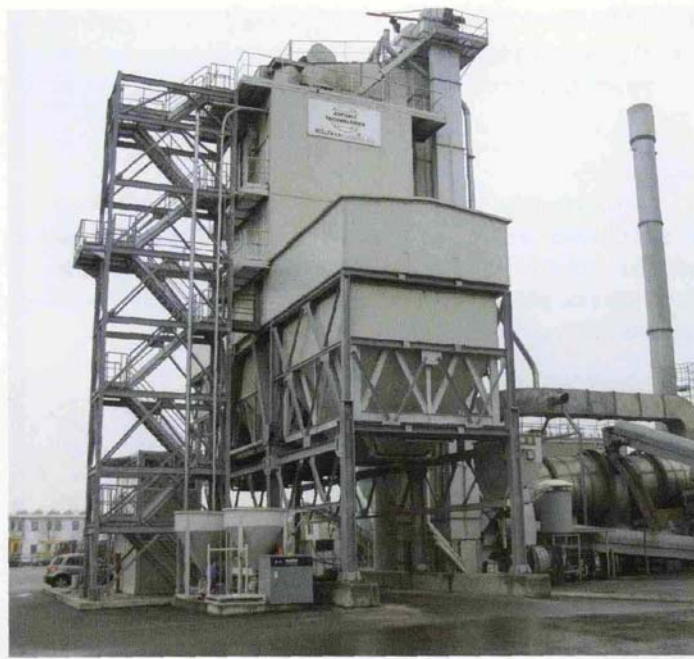
L'impianto di produzione asfalto realizzato dalla Asphalt Technologies per l'Impresa Bacchi