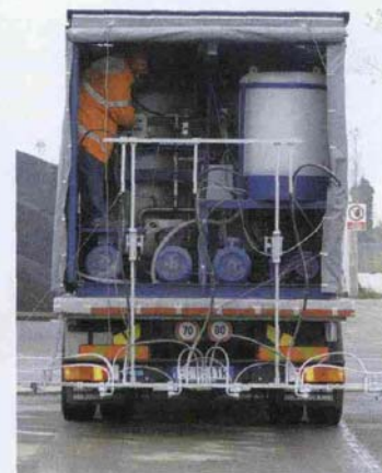
Sopra: biossido di titanio e il macchinario per la stesa