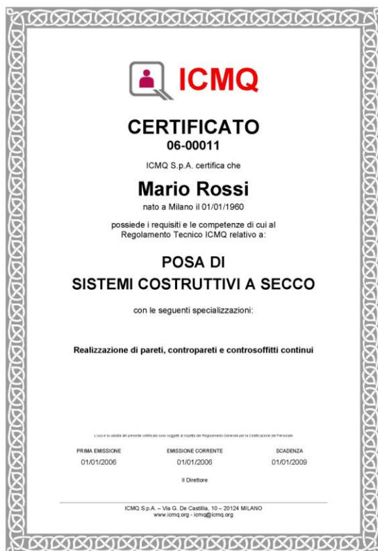
ESEMPIO DI CERTIFICATO INTESTATO A PERSONA SINGOLA

Ogni singolo candidato che supera l'esame finale, riceve un certificato ed una tessera identificativa.