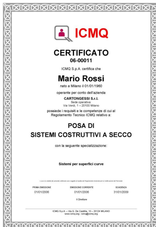
ESEMPIO DI CERTIFICATO INTESTATO A PERSONA E AZIENDA